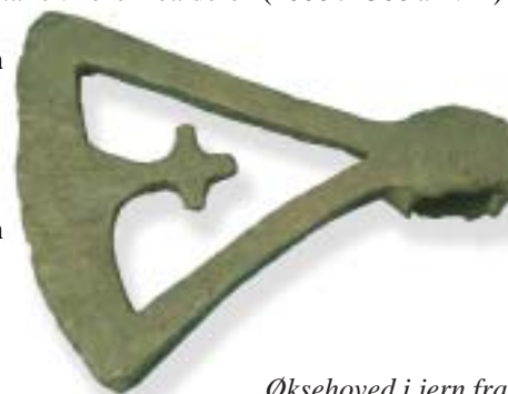
Økshoved i jern fra slutningen af 900-årene.

De høje varmegrader, trækul kan give, var en forudsætning for den tidlige udvinding og bearbejdning af metaller. I bronzealderen (2000 til 500 år f.Kr) importerede danskerne kobber og tin, som blev smeltet sammen til bronze. Det krævede temperaturer på omkring 1000 °C. I jernalderen (500 f.Kr til 800 e.Kr) steg behovet for trækul voldsomt, hvilket betød en reduktion i skovens udbredelse. Jernudvindingen fra myremalm fra de danske moser krævede temperaturer på op til mere end 1500 °C, hvilket kun kunne opnås ved brug af trækul.